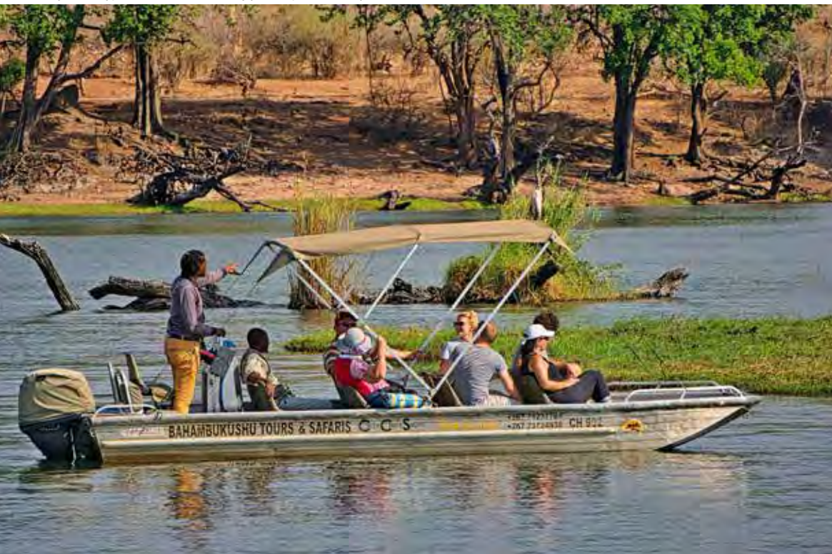
Rejs łodzią pozwala na obserwację wodnych zwierząt