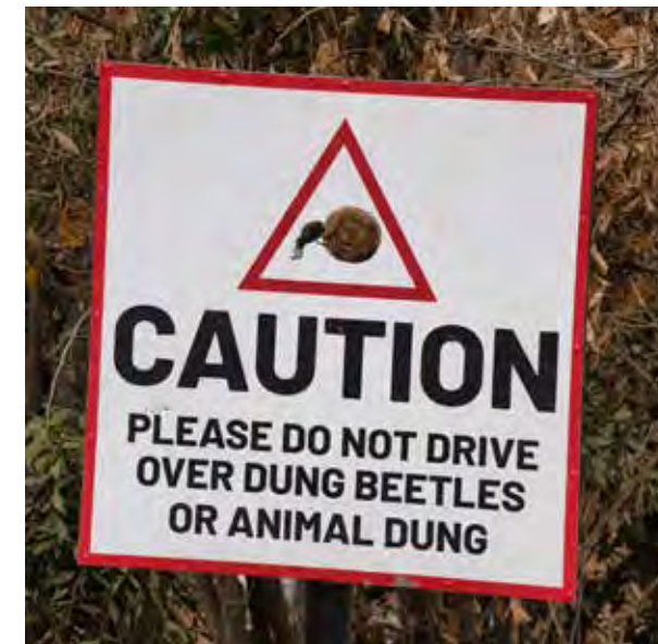
Nawet odchody zwierząt bywają oazą życia; nie rozjeżdżaj ich autem!